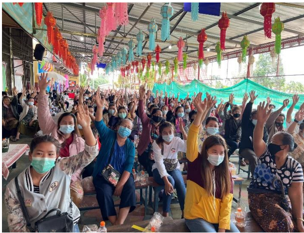
ภาพประกอบการดำเนินการเสริมสร้างค่านิยมและวัฒนธรรมองค์กร